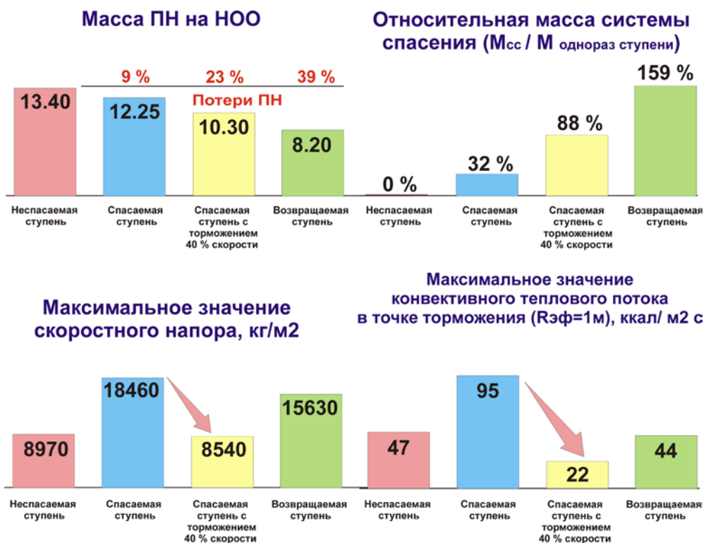
Рис. 3. Влияние схемы полёта первой ступени на энергомассовые характеристики РН

мальную величину теплового нагружения конструкции сопел ДУ и в два раза снизить скоростной напор. Необходимость столь радикального снижения уровня тепловых нагрузок, действующих на сопло неработающего двигателя, свидетельствует о том, что даже для достаточно простого ЖРД открытой схемы типа «Merlin», установленного на РН «Falcon-9», вопросы теплозащиты его конструкции являются критическими для выбора рациональной схемы спасения. Следует также отметить, что относительная масса системы спасения по второму варианту, составляющая 88 % от массы одноразовой ступени, соизмерима с относительной массой самолётной системы спасения, составляющей 90-100 %.